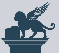
immagine di copertina:

Università Ca' Foscari Venezia Biblioteca Nazionale Marciana 11-13 ottobre 2018